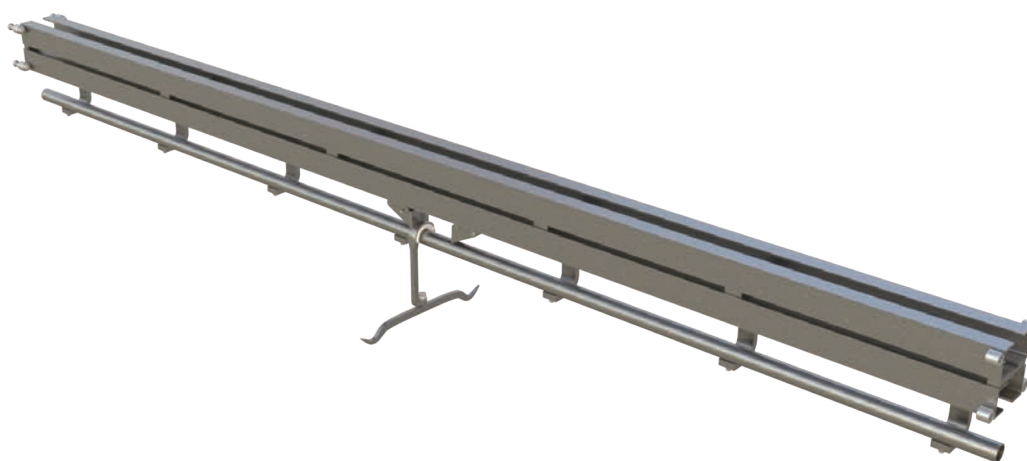
Convoyeur Duoplan avec gambrel